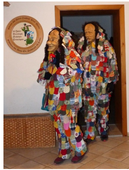
Text & Foto: VS Trauchgau