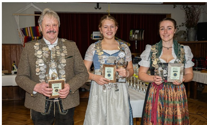
Text & Foto: SV Buching-Berghof

Samstag, 07.02.26, Samstag, 14.02.26, Samstag, 21.02.26, Samstag, 28.02.26.